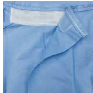
便利な面ファスナー