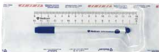
ガンマ線滅菌済み、15cmルーラー付き