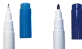
極細(0.3mm)、中字(0.7mm)の2サイズ